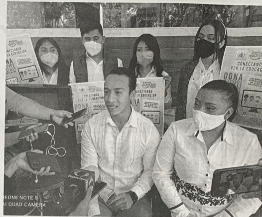
LA COLECTA SE INICIÓ ESTE MIÉRCOLES Y CONCLUIRÁ el 7 de noviembre: Asociación Civil Regalando Sonrisas